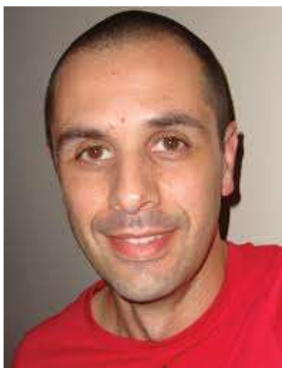
Autor: Luís Fernandes

https://www.youtube.com/watch?v=7qn8xIjEyow